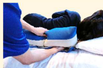
自重シートとクッションの間に手を入れて、患者の体の下に手とともに自重シートを敷きこむ。

身体が安定するように、自重シート及びクッションを調整する。※2～3時間おきに体位変換される場合は、自重シートの半分を目安に敷きこんでください。シートが取りにくくなりますので。