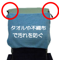
タオルや不織布 で汚れを防ぐ