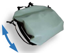
左右のひもによる伸縮で 厚み調整