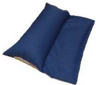
ピタットくん90ワイド