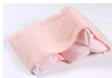
ふたこぶラックン