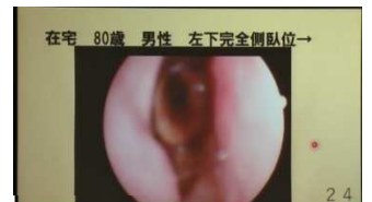
内視鏡動画は福村直毅先生より提供。